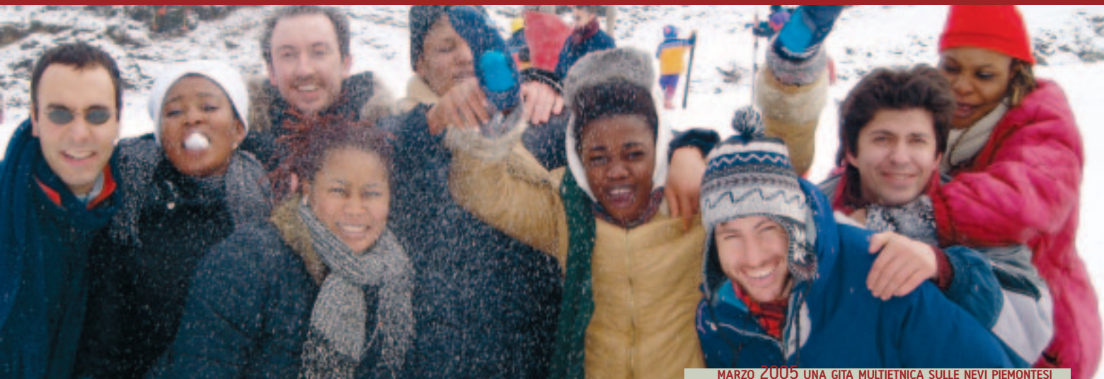
MARZO 2005 UNA GITA MULTIETNICA SULLE NEVI PIEMONTESI

donne, dando loro informazioni, amicizia, accoglienza e aiuto per lasciare la strada; nel 2004 quasi 30 hanno iniziato dei percorsi di reinserimento e sono ora libere di fare una vita normale. Anche quelle rimaste per mille motivi in strada sono diventate nostre amiche condividendo con noi ricorrenze e persino compleanni. E molte di queste hanno frequentato i nostri corsi di lingua italiana, che ogni anno ci fanno incontrare almeno 160 donne straniere, quasi tutte appena arrivate in Italia e almeno 30 minori che frequentano le scuole dell'obbligo a cui diamo una mano per fare i compiti, migliorare l'italiano e fare insieme delle esperienze aggregative con giovani italiani. Nel periodo estivo ci spostiamo nei quartieri dove maggiore è la concentrazione di degrado e difficoltà: attraverso progetti di animazione cerchiamo di coinvolgere i giovani che trascorrono per strada gran parte delle giornate. Figli spesso