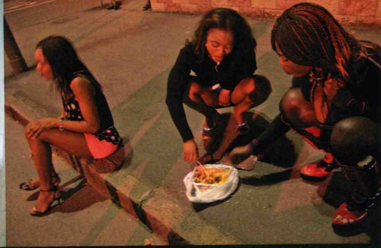
Schiave e libere Ragazze ancora sulla strada e altre entrate nel Programma di Protezione. In alto a destra, una inizia una serie di controlli sanitari presso l'Ospedale Amedeo di Savoia. In basso a sinistra, nuova vita in una casa di accoglienza